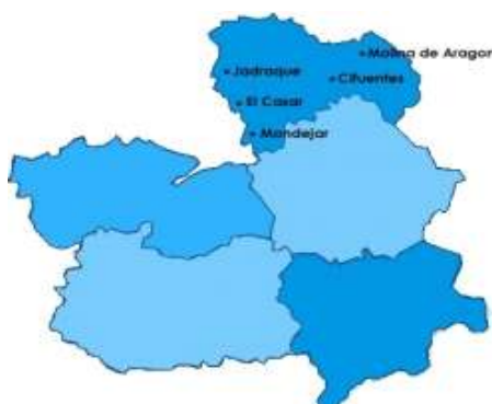
Figura 1: Zona de asentamiento de la población inmigrante en Guadalajara.