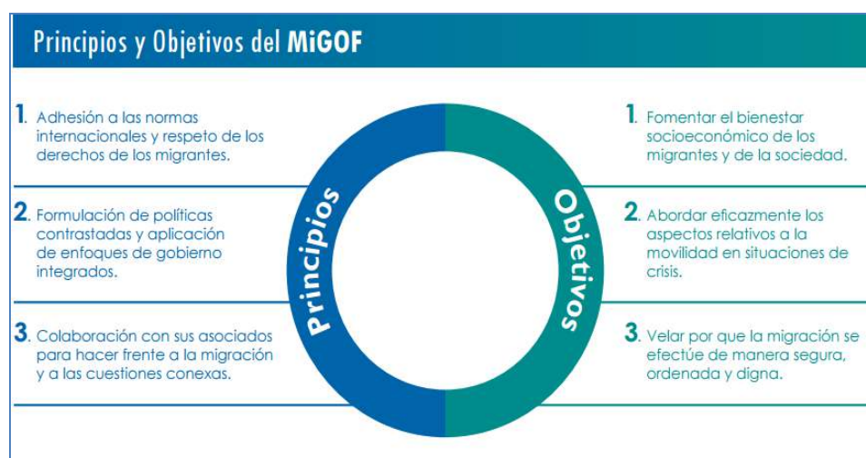
Figura 1. Marco de Gobernanza sobre la Inmigración