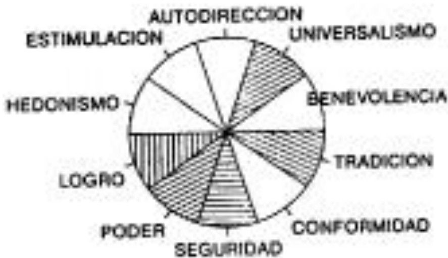
Ilustración 4: Los valores del sistema de Schwartz

Adicionalmente, esta teoría del contenido y estructura universal de los valores humanos (Schwartz y Bilsky, 1987, 1990) predice una serie de relaciones dinámicas entre los tipos motivacionales, entre los grupos de valores que pueden ser buscados y realizados de forma conjunta (hipótesis de compatibilidad), o entre los valores contenidos en dichos tipos cuando se oponen unos a otros para su realización (hipótesis de conflicto).