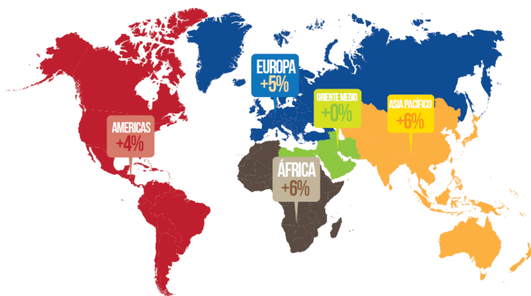
Mapa 1. Llegadas de turistas internacionales en 2013.

En las últimas seis décadas, el desarrollo de esta actividad ha experimentado una continua expansión y diversificación, convirtiéndose el “turismo moderno” en el principal motor del progreso económico creando empleo y empresas, desarrollando infraestructuras y obteniendo beneficios. Dentro de este panorama, los países miembros de la OCDE desempeñan una función de liderazgo en el turismo internacional. Al mismo tiempo, han surgido nuevos destinos junto a los tradicionales de Europa y Norte América (UNWTO, 2014: 2).